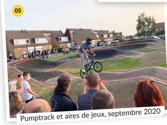
05 Pumptrack et aires de jeux, septembre 2020