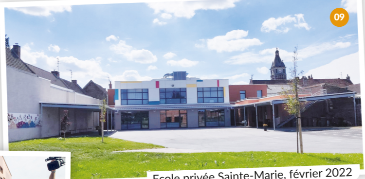
09 Ecole privée Sainte-Marie, février 2022