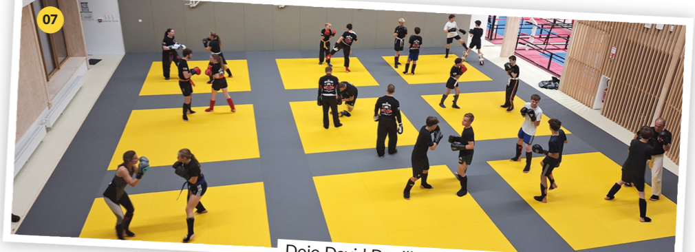
07 Dojo David Douillet et salles de danses, août 2025