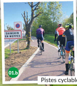
Pistes cyclables vers Marquillies et RN41, été 2022