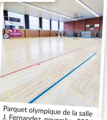
06 Parquet olympique de la salle J. Fernandez, novembre 2024