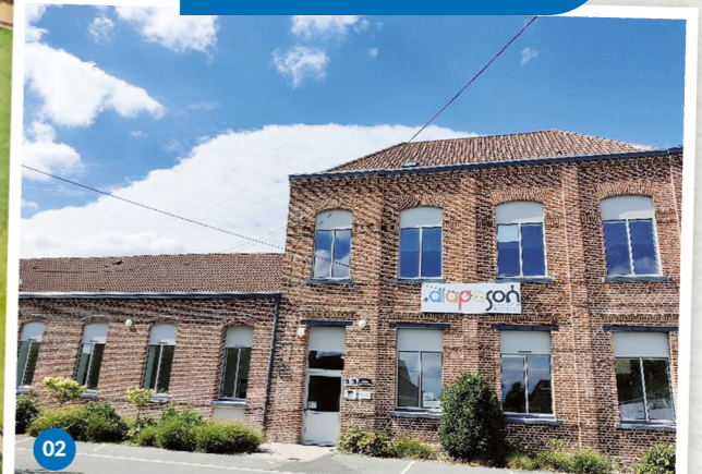
02 Espace Musical Le Diapason, septembre 2020