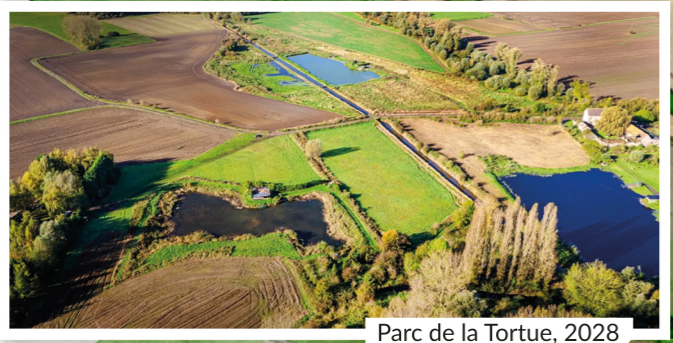
05 Parc de la Tortue, 2028