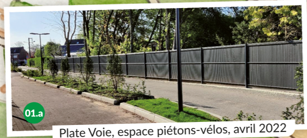
01.a Plate Voie, espace piétons-vélos, avril 2022