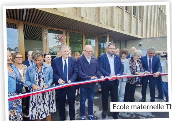
10 Ecole maternelle Thomas Pesquet, août 2025