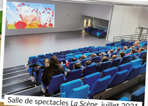
03 Salle de spectacles La Scène, juillet 2021