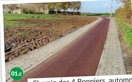
01.c Chemin des 4 Bonniers, automne 2022