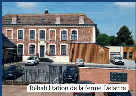
Réhabilitation de la ferme Delattre

Comme dans un foyer, notre gestion repose sur un principe simple : dépenser utilement, investir durablement et préserver l'équilibre budgétaire. Toujours avec mesure, en s'assurant que l'on pourra rembourser sereinement demain.