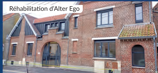
Réhabilitation d'Alter Ego

En effet, moins d'habitants, c'est moins d'élèves dans nos écoles, moins de clients pour nos commerçants et artisans, moins d'adhérents dans nos associations, moins d'utilisateurs des structures publiques bref moins de dynamisme.